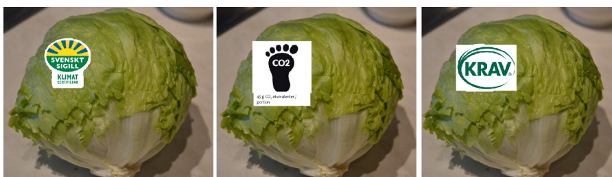
Bild 1. Tre klimatmärkningar