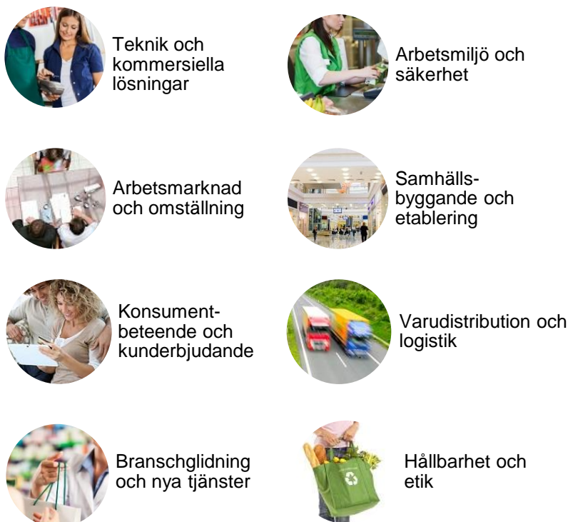
Figur 1. Åtta för handelsnäringen prioriterade områden presenterade i agendan Initiativ för att stärka handeln (2021). Länk till agendan .

Syftet med den forskning som finansieras av Handelsrådet är att generera relevant kunskap till nytta för handels arbetsgivare och arbetstagare, men också kunskap om branschen som helhet. Handelsrådet arbetar för att öka statusen och kunskaperna om handeln i samhället. Det är därför av yttersta vikt att den forskning som bedrivs med stöd av Handelsrådet ger konkret nytta och är relevant för alla typer av handelsföretag. Forskningen ska bidra till att höja kompetensen inom handelsbranschen och bidra till att handeln är en attraktiv bransch i alla avseenden. Ny kunskap är en viktig faktor för att stärka handels konkurrenskraft och skapa goda villkor för både företag och medarbetare.