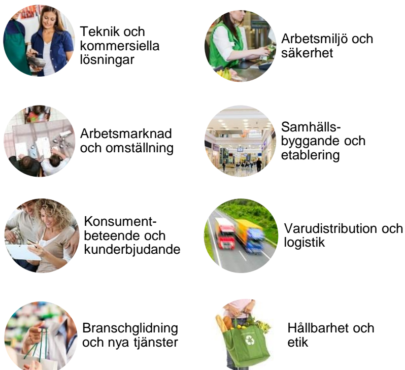
Figur 1. Åtta för handelsnäringen prioriterade områden presenterade i agendan Initiativ för att stärka handeln (2021). Länk till agendan .

Syftet med den forskning som finansieras av Handelsrådet är att generera relevant kunskap till nytta för handels arbetsgivare och arbetstagare, men också kunskap om branschen som helhet. Handelsrådet arbetar för att öka statusen och kunskaperna om handeln i samhället. Det är därför av yttersta vikt att den forskning som bedrivs med stöd av Handelsrådet ger konkret nytta och är relevant för alla typer av handelsföretag. Forskningen ska bidra till att höja kompetensen inom handelsbranschen och bidra till att handeln är en attraktiv bransch i alla avseenden. Ny kunskap är en viktig faktor för att stärka handels konkurrenskraft och skapa goda villkor för både företag och medarbetare.