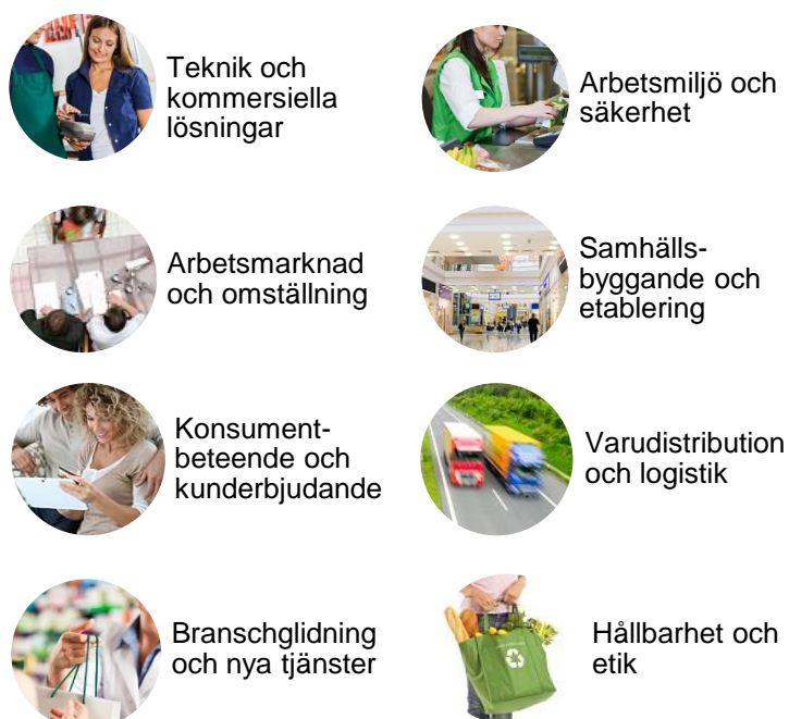
Figur 1. Åtta för handelsnäringen prioriterade områden presenterade i agendan Initiativ för att stärka handeln (2016).

Att skapa engagemang kring forskning och utveckling är ett prioriterat område för Handelsrådet. Målet är att öka förståelsen för att ny kunskap är en viktig faktor för att stärka handelns konkurrenskraft och skapa goda villkor för både företag och medarbetare.