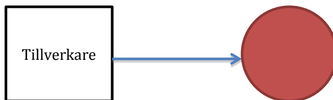
Figur 1. Klassisk ansvarsfördelning: tillverkare ansvarig för sin produkt

För att återknyta till ansvarsdiskussionen så visar CE-systemet upp en komplex ordning där ansvar blir svårt att lokalisera enligt klassiska ansvarsprinciper, enligt vilka man är ansvarig för det man tillverkar, precis som att man är ansvarig för de beslut man själv fattar. Figur 1 illustrerar en sådan klassisk ansvarsrelation där tillverkare är ansvariga för produkter de har tillverkat. Figur 2 illustrerar det system som vuxit fram med Nya metoden och den komplexitet som ansvarsfördelning för leksaker består i. Det gröna sträcket indikerar gränsen till EU:s inre marknad och den röda cirkeln illustrerar leksaken.